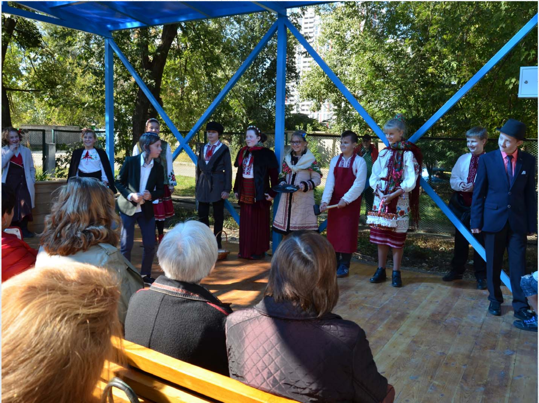
і перша вистава ... звісно за творами В.О.Сухомлинського