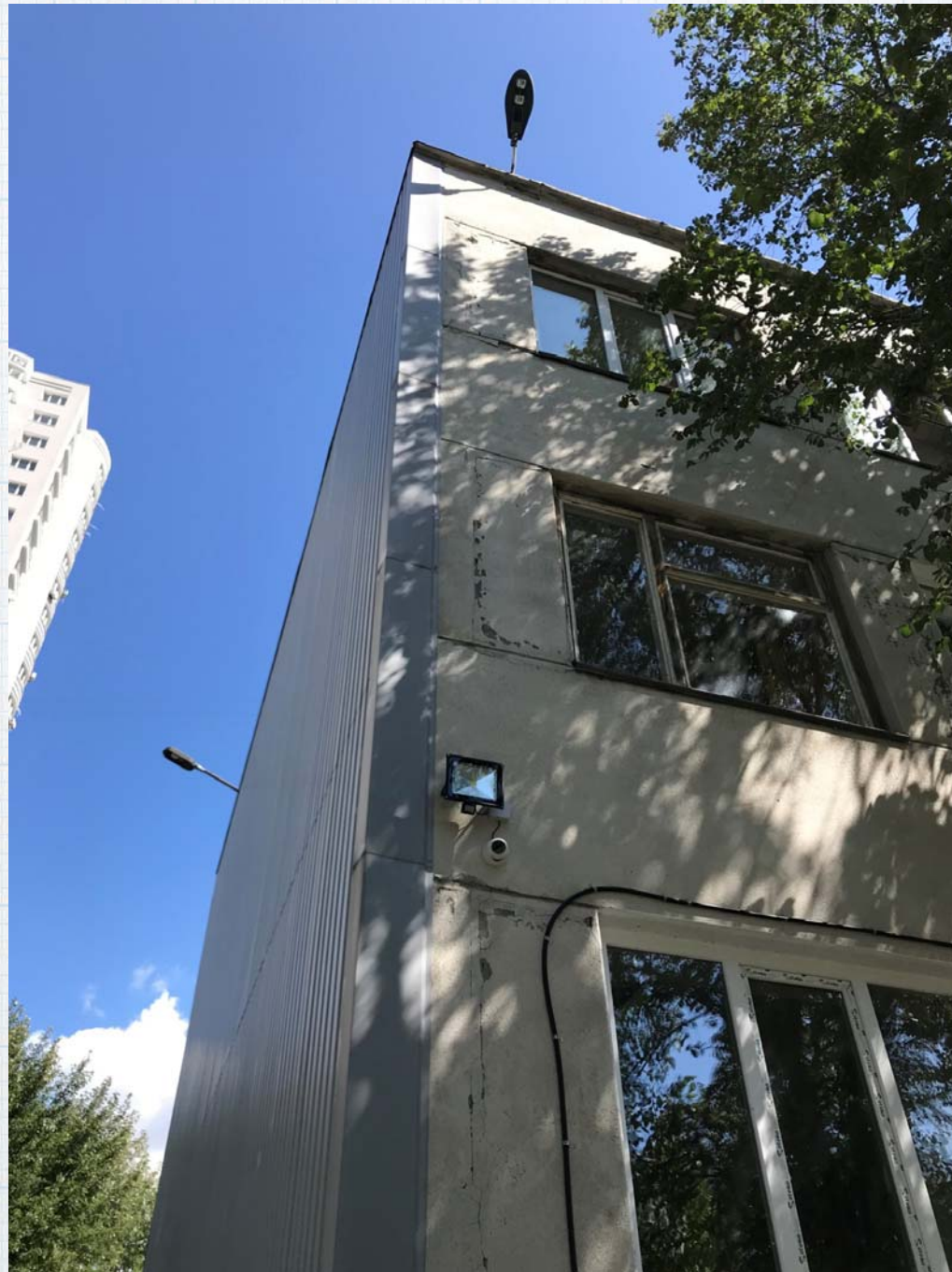
Освітлення та відеоспостереження